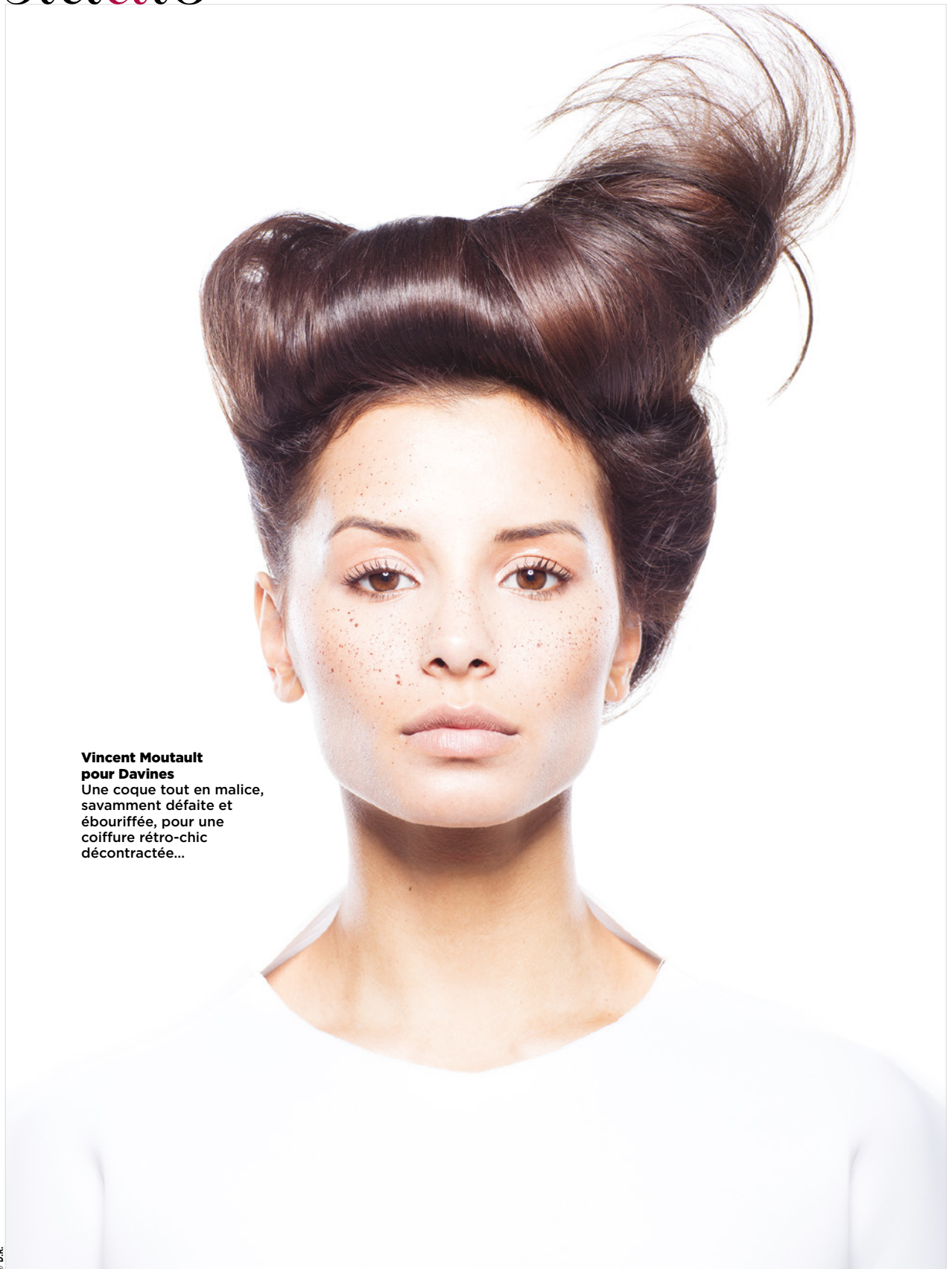
Vincent Moutault pour Davines Une coque tout en malice, savamment défaite et ébouriffée, pour une coiffure rétro-chic décontractée...