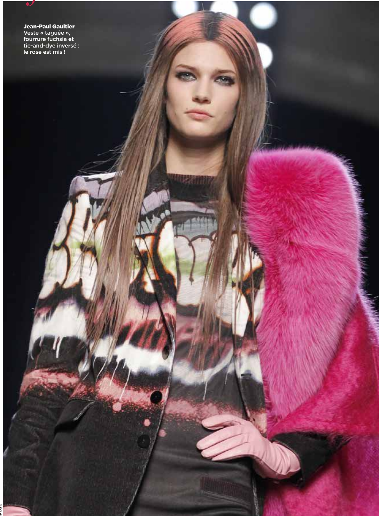
Jean-Paul Gaultier Veste « taguée », fourrure fuchsia et tie-and-dye inversé : le rose est mis !