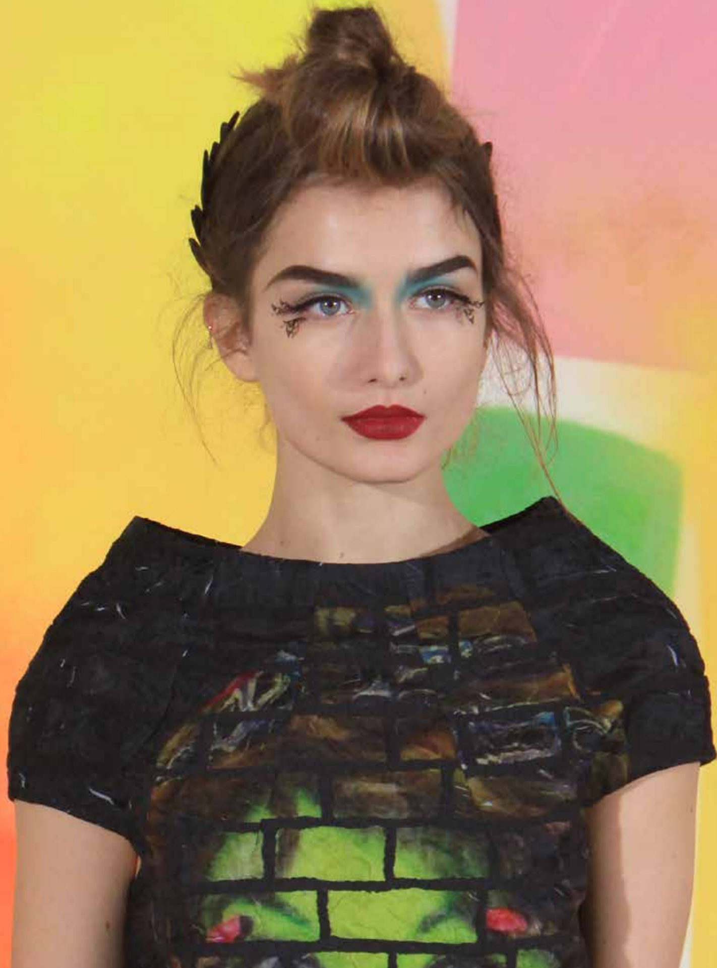
Manish Arora Bibis de plumes et chignons buns revisités : une création à la fois moderne et rétro...